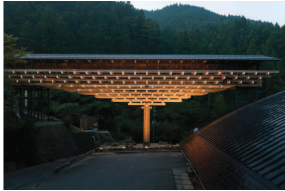
Izquierda: Foto de Kengo Kuma y asociados Derecha: Museo Puente de Madera de Yushara. Foto de Takumi Ota