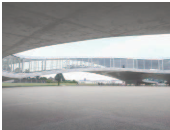
Izquierda: Foto de Takashi Okamoto. Derecha: Centro de Aprendizaje Rolex. Foto de SANAA