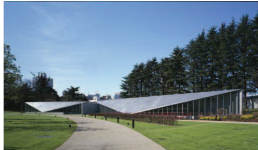
Izquierda: Foto de Tadao Ando Architect & Associate Derecha: 21_21 DESIGN SIGHT. Foto de Mitsuo Matsuoka