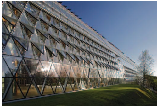
Izquierda: Foto de H.G. Esch. Derecha: European Investment Bank. Foto de Andreas Keller