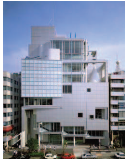
Derecha: Spiral.