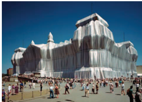
Izquierda: Christo y Jeanne-Claude en “The Gates”, febrero de 2005 Derecha: Wrapped Reichstag, Berlín, 1971-95