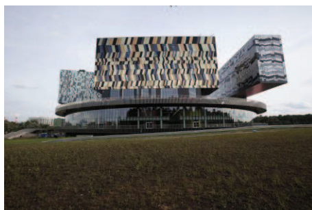
Derecha: La Escuela de Administración de Empresas de Moscú- Skolkovo.